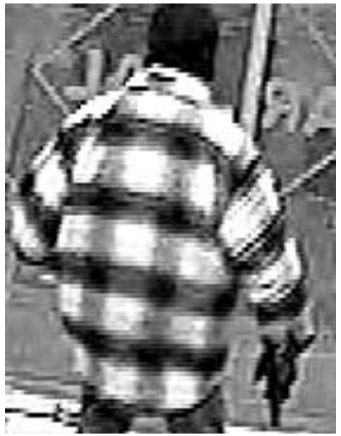
Wer kennt diese Jacke?

Die Polizei bittet um Hinweise an ☎ 54.50.