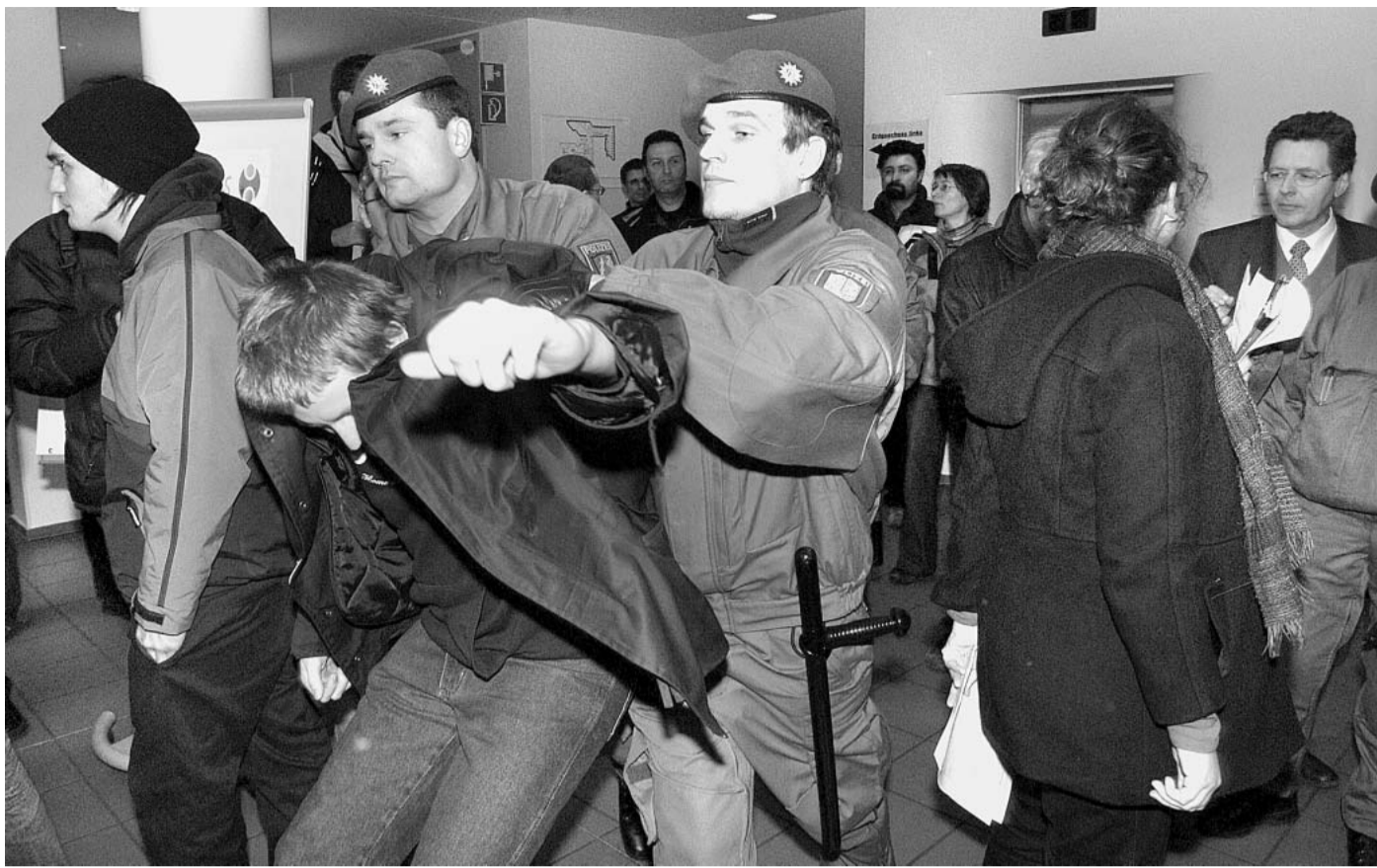
Im Polizeigriff: Eine Einsatztruppe komplimentierte am 3. Januar Demonstranten gegen Hartz IV aus dem Foyer der Agentur für Arbeit. Zuvor hatten der Leiter der Agentur (rechts) und die Protestierer vergeblich nach einer einvernehmlichen Lösung gesucht.

NW Neue Westfälische OSTWESTFÄLISCHES STÄRKE BREITEN